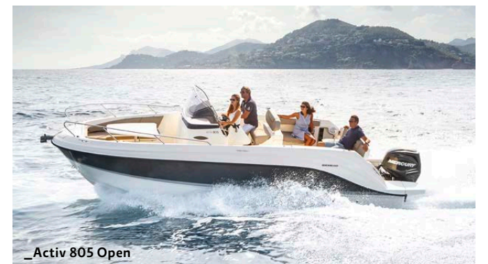
_Activ 805 Open