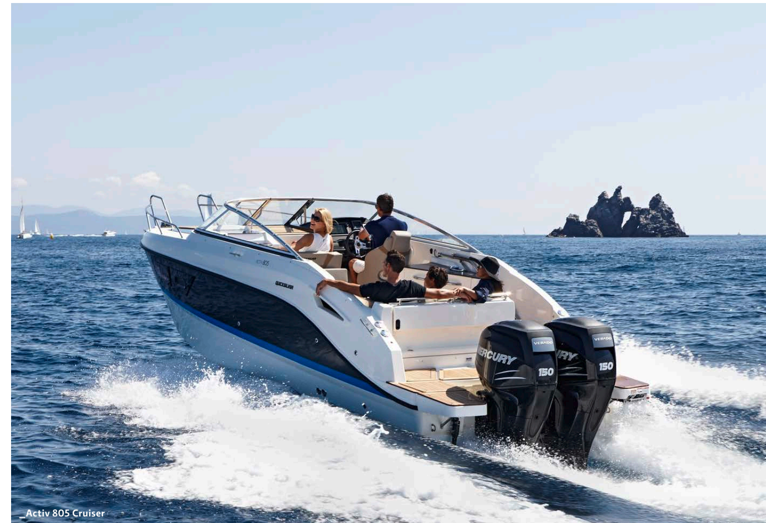
_Activ 805 Cruiser