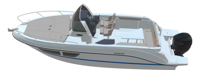
_Activ 805 Sundeck

_Brunswick Marine in Switzerland _3235 Erlach, Tel. 032 338 81 00 _www.quicksilver-boats.com